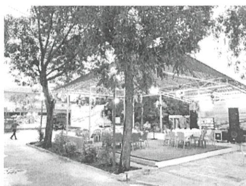
Nhà hàng sân vườn