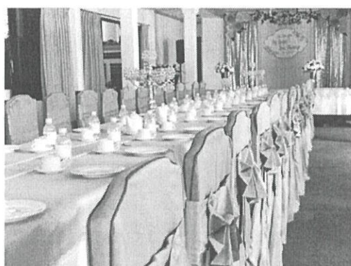
Nhà hàng Hoa Sứ