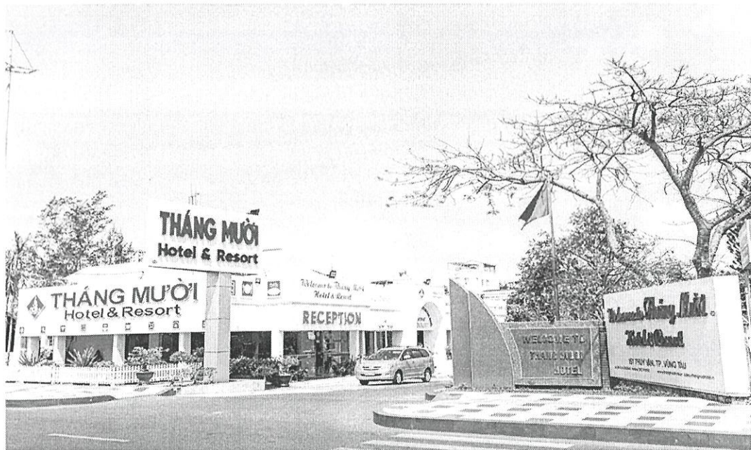
Tháng Mười Hotel & Resort

Không gian rộng lớn, môi trường trong lành, sự sạch sẽ và ngăn nắp của khu vực lưu trú sẽ mang lại sự thoải mái và bình yên cho du khách mỗi khi đến với Tháng Mười Hotel & Resort.