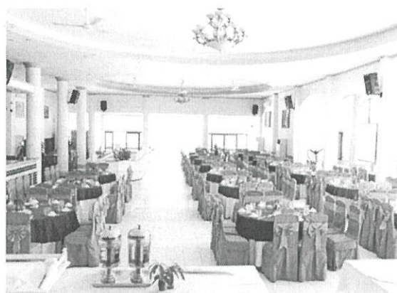
Nhà hàng Festival