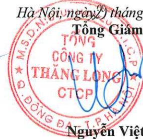
Nguyễn Việt Hà