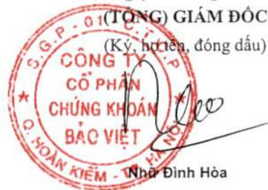
Nhà Đỉnh Hòa