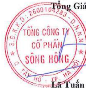
Lã Tuấn Hưng