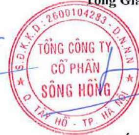
Lã Tuấn Hưng